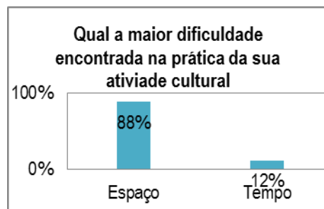
Tabela 2. Dificuldade na prática da atividade.

No prosseguimento das entrevistas foi explorada a necessidade de cada usuário (Ver Tabela 3) onde a maioria dos entrevistados afirmou que o que mais queria em um espaço novo era Infraestrutura, Segurança e Vegetação.