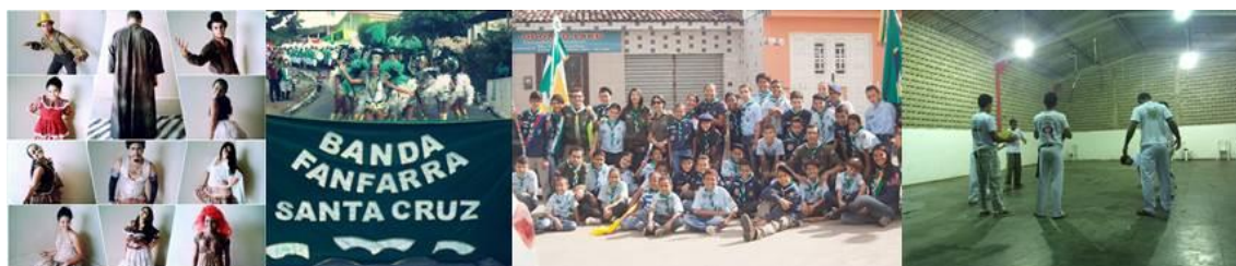
Figura 2: Atividades culturais que participaram das entrevistas. (Da esquerda para a direita: Grupo de Teatro Camboio de Doido, fonte: Igor Rozza; Banda Fanfarrã Santa Cruz, fonte: Levy; Grupo Escoteiro Oficina Azimute 6º AL, fonte: Própria; Grupo de Capoeira Arte na Roça, fonte: Própria).

As duas primeiras perguntas foram sobre o espaço utilizado e as dificuldades encontradas para a prática das atividades culturais neste (Ver Tabela 1 e 2), onde suas respostas foram unânimes, pois a maioria respondeu que a falta de espaço é fator principal no que diz respeito à falta de estímulo eo ambiente existente não é compatível com suas necessidades.