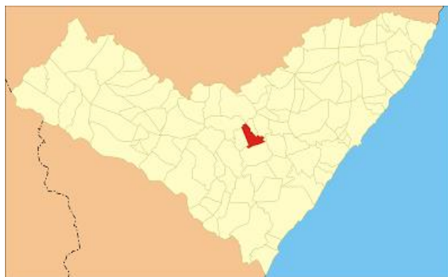
Figura 1: Mapa de Alagoas evidenciando a cidade de Taquarana, 2012.

O município de Taquarana - AL, localizada no interior do Agreste Alagoano, tem população estimada de 19.020 habitantes distribuídos numa área total de 166,046 km 2 - IBGE (Instituto Brasileiro de Geografia e Estatística, 2014) (Ver Figura 1) e não dispõe de um equipamento que possa satisfazer a deficiência de seus habitantes perante o âmbito cultural. A população sente necessidade, pois há muitos jovens que buscam esse tipo de entretenimento, considerados por muitos uma melhoria de vida.